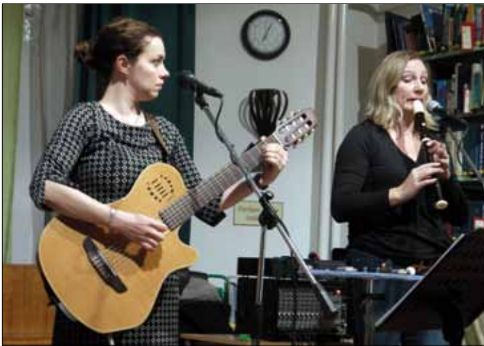
A Garabonciás Együttes

A Kölcsey Ferenc Városi Könyvtár minden évben igyekszik sokszínű, változatos programok szervezésével hozzájárulni Dunakeszi mozgalmas kulturális életéhez. Kiállítások, író-olvasó találkozók, zenés műsorok, irodalmi előadások sora ad lehetőséget olvasóinknak a minőségi szórakozásra, kikapcsolódásra.