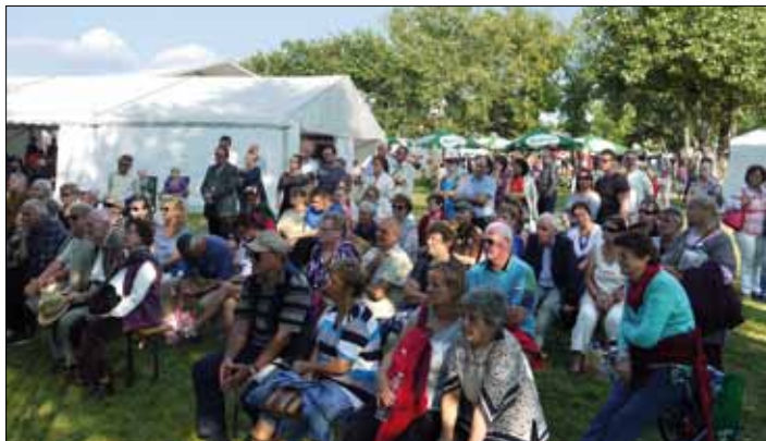
Az Irodalmi Szalon közönsége a Dunakeszi Fesztén

hallgatása mellett a találkozásra, kötetlen beszélgetésre.