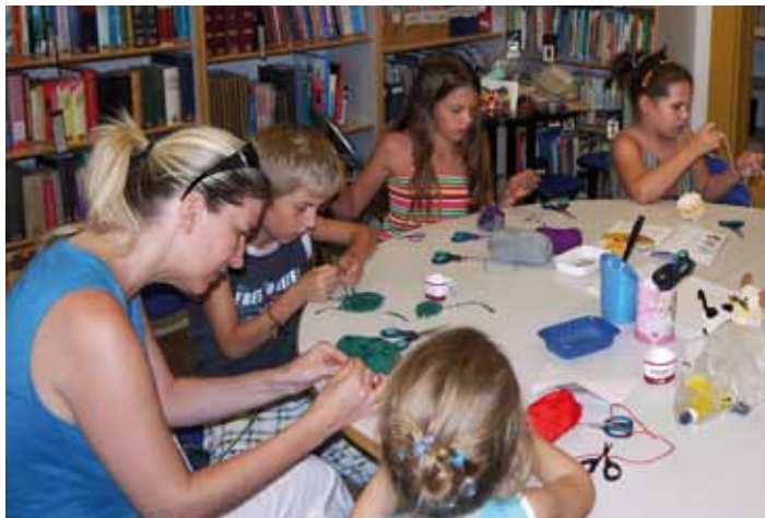
Kézműves foglalkozás a gyermekrészlegen