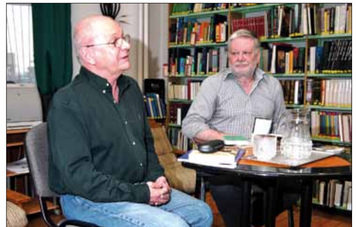
Bereményi Géza és Tarján Tamás

Május 14-én került sor az év első Irodalmi Szalonjának megrendezésére. A vendég Bereményi Géza író, filmrendező Tarján Tamás irodalomtörténésszel beszélgetett az életéről, pályájáról.