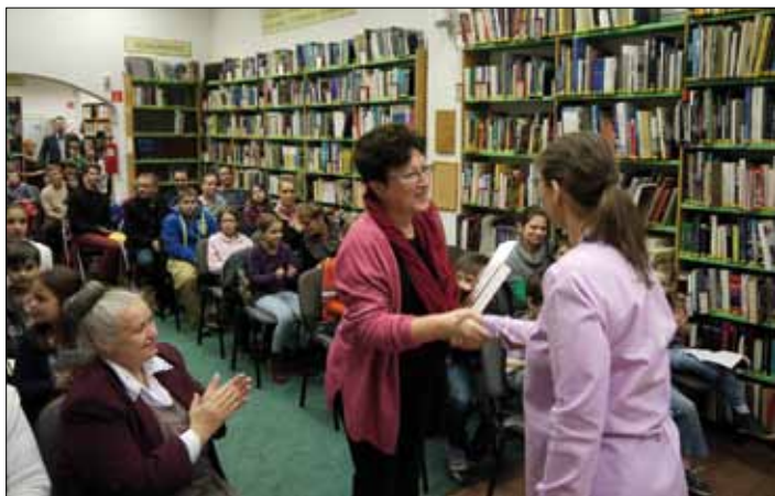
Az Olvasó Város program díjátadása