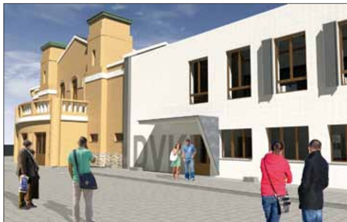
A z INCORSO Design építészmuhely látványtervei