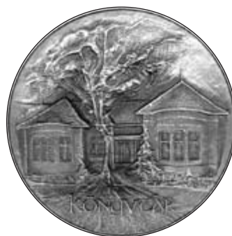
Lengyel István: Könyvtár (érem)