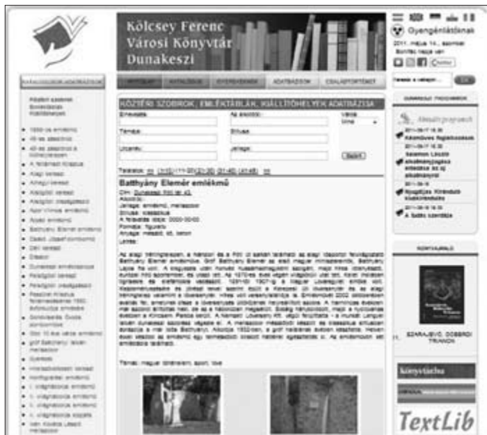
Részlet a készülő webportál helyismereti adatbázisából

A Látnivalók Dunakeszin című projektünk Dunakeszi nevezetese épületeit, műemlékeit, köztéri műalkotásait mutatja be virtuálisan a gyalogosan, kerékpárral és kerekesszékekkel