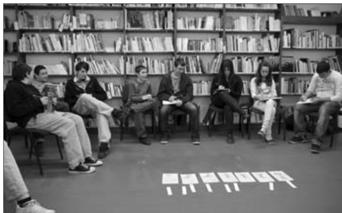
A Bárdos Lajos Általános Iskola foglalkozásán

A serdülők lelkében lévő mozdulásokat nyomon lehetett követni egy adott foglalkozás tükrében is. A fegyelmetlen, néhol kifejezetten szemtelen fiúk és lányok négy óra elteltével már másképp viselkedtek – farkasjegyeik mellett a bárányjegyek is megjelentek rajtuk. Visszajelzéseik szerint mindebben nemcsak a történet mentén kialakult beszélgetésnek, hanem a zenének és a sok játéknak is szerepe volt. Meglepte őket, hogy ez egy olyan hely, ahol nem kell sietni, ahol mindenki véleménye egyaránt fontos, ahol minősítések helyett érveket várunk. A kamasz lélekből fakadóan a provokálás, a terapeuta „tesztelése” sem maradt el. De amikor látták, hogy itt nincsenek tabu témák, hogy nyíltan és humorral bármiről lehet beszélni, akkor felhagytak a próbálkozásokkal. Így aztán a terapeutának nem is nagyon kellett őket ill. a beszélgetést visszaterelni a mesebeli patakpartra. Ahogy arról korábban már volt szó, elmélyülési lehetőséget jelentett