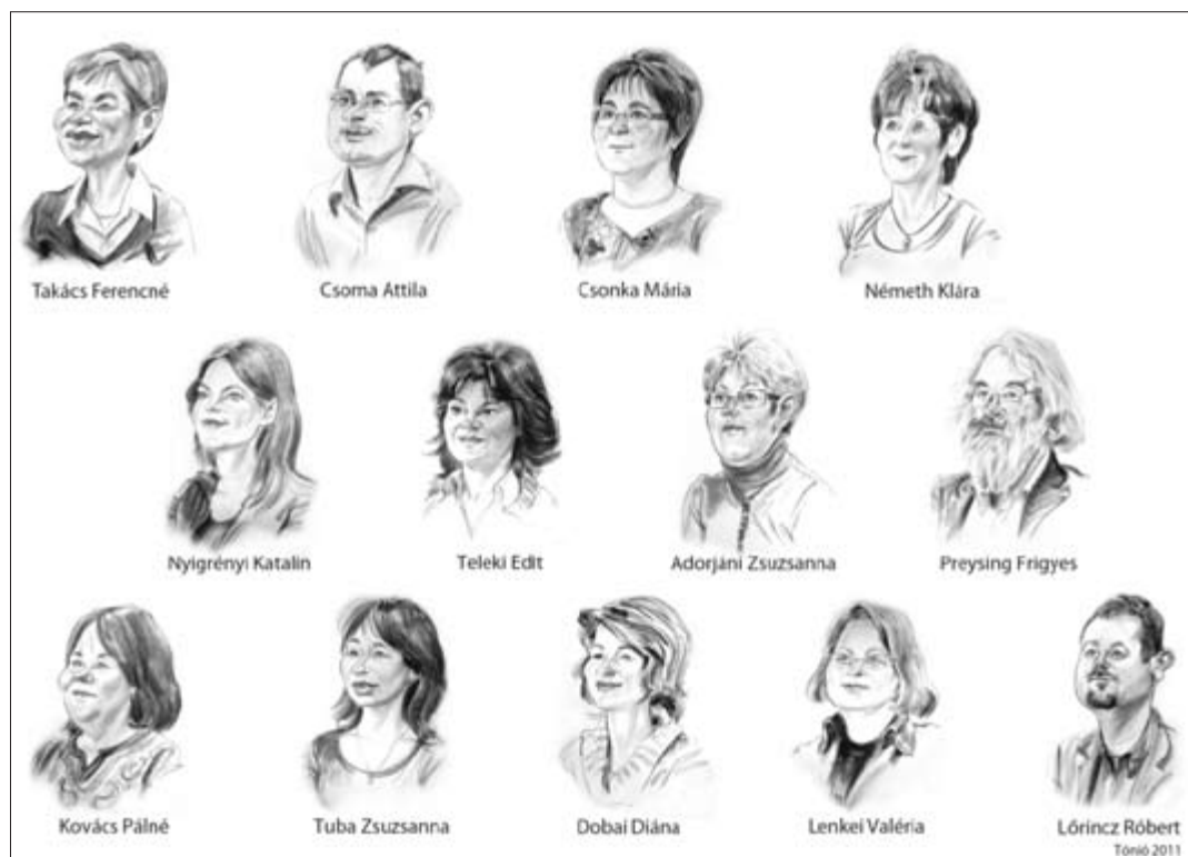
A Kölcsey Ferenc Városi Könyvtár dolgozói 2011-ben Tónió ajándéka a jubiléum könyvtárnak