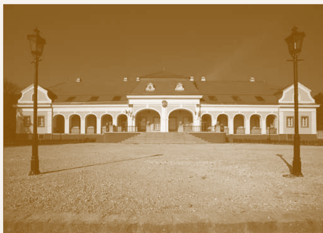
A pomázi kastély napjainkban

a családba benősült Telekieké lett a kastély, akik eklektikus stílusban részben átépítették, és 1944-ig használták, de négy szoba továbbra is a Wattayak rendelkezésére állt. A gróf széki Teleki címer a kastély hátsó bejárata felett található. A Wattayak a kastély átadása után a kastélytól nem messze felépített „kis kastélyba” költöztek át. A kastély jelenleg a pomázi önkormányzat kezelésében van, és Teleki-Wattay-kastély vagy Magyar Kóruskastély néven bentlakásos rendezvényközpontként és zeneművészeti szakmai bázisként működik. A kastélyban megtekinthető a Wattay családról szóló állandó kiállítás.