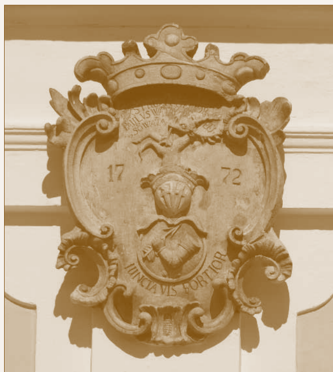
A kastélyon lévő Wattay címer

1761-ben a cserebirtokként kapott területekre III. Pál lakosságot szervez, így Bars és Hont vármegyéből kisnemeseket telepített Áporka pusztára.