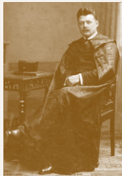
Békési segédlelkészként 1912 körül

1914 novemberében jelentkezett katonának. Betegápoló lelkésszé való debreceni kiképzése után egy beszercebányai „ katonai megfigyelő-állásra ” helyezték. 1916. január 14-től három nap szabadságot kapott, hogy