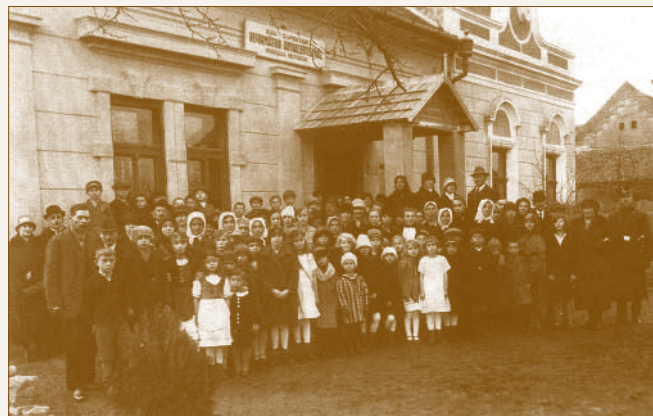
A Szent Mihály utcai imaház