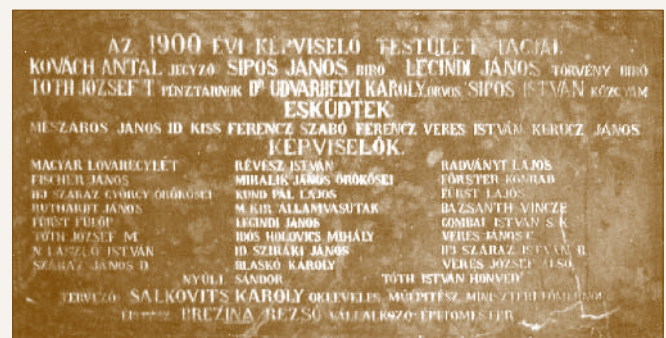
A városháza régi bejáratánál lévő, az 1900-as képviselő-testület tagjainak nevét megőrző emléktábla

Ebben az évben dr. Udvarhelyi Károly – ki 1890-től 1895-ig a főti körorvos volt – a dunakeszi községi orvosi állást elnyeri, s így bekerül Dunakeszi képviselőtestületébe is. Neve a városháza régi bejáratában, és a főtérre néző márványtáblákon ma is olvasható.