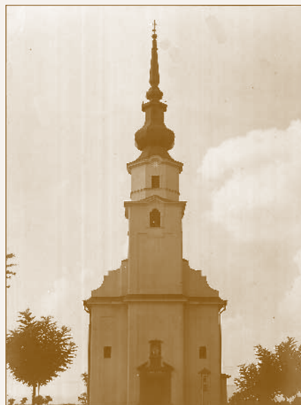
A Jézus Szíve templom

A harmincas években folyamatosan nőtt az üzem munkásainak létszáma, és Dunakeszi északi része (Révdűlő, Banktelep) is kezdett beépülni. A szükségkápolnában már nem fértek el a miséken, ezért 1939-ben templomépítő bizottság alakult, ami a lakosság adományai és a MÁV Igazgatóság anyagi segítségével 1942-től 1944-ig felépítette a Jézus szíve plébániatemplomot. 40 Az egyhajós, egytornyú, egyenes szentélyzáródású, hagyma alakú toronysisakkal koronázott neobarokk templomot Pázmándi István műegyetemi tanár tervezte, aki Wälder Gyula köréhez tartozott.