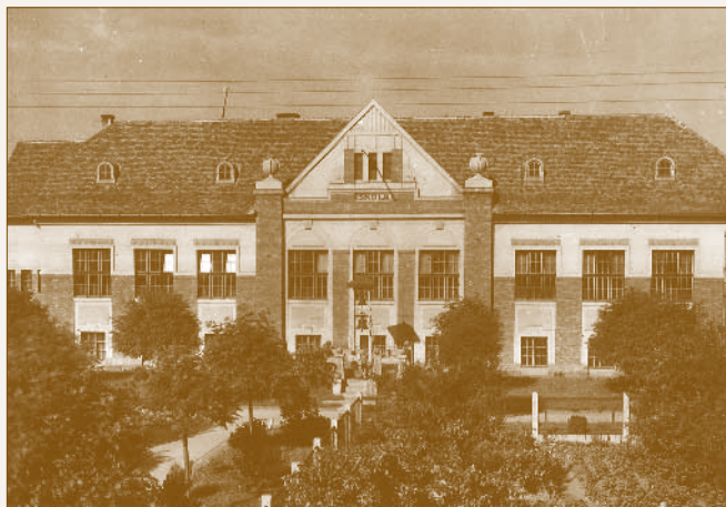
A MÁV műhelytelepi elemi (ma Bárdos Lajos) iskola

A hitélet gyakorlósa érdekében a műhelytelepi katolikus egyházközség az 1928-ban felépült elemi iskola alagsorában egy szükségkápolnát alakított ki. 38 A protestáns híveknek a