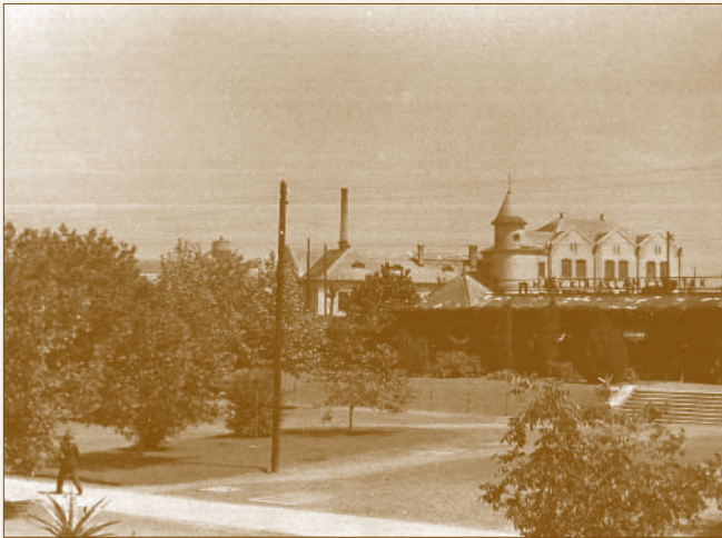
A MÁV Főműhely főbejárata, háttérben az azóta lebontott Bagolyvár

A dunakeszi főműhelyt a MÁV vezetése kezdetől fogva egy lakóteleppel együtt képzelte el, amely elkülönül a település hosszabb idő alatt, spontán kialakult szövetétől. Ezen a kolónián kívánták modern, egészséges és alacsony bérleti díjú lakásokhoz juttatni a „zöldmezős beruházásként” felépülő üzem munkásait és tisztviselőit.