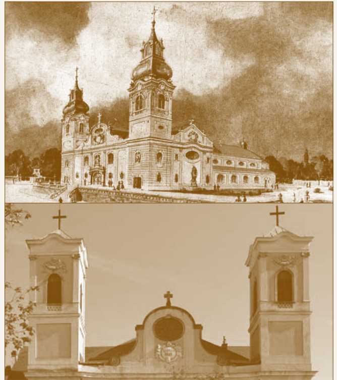
A tervezett és a jelenlegi toronysisakok

Amikor a szüleim hagyatékából előkerült korabeli színes képes levelezőlapon megpillantottam a templomunk impozáns barokk toronysisakokkal ábrázolt képét, büszkeség töltött el. Önkéntelenül is összehasonlítottam a jelenleg is látható, jellegtelen és formájában oda nem illő toronysisakkal.