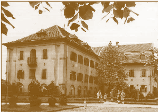
A Legényotthon épülete

A műhelyi alkalmazottaknak és azok családtagjainak a MÁV orvosi rendelést, a csecsemőknek pedig heti egy nap zöldkeresztes rendelést biztosított. 34