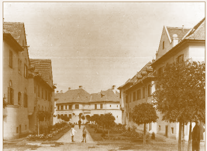
MÁV lakótelepi utcarészlet

Kotál korábban részt vett a Wekerle-telepre kiírt településtervezési pályázaton, és a megvalósításkor is több típus-terv kidolgozására kapott megbízást. 16 Egy sajátos beépítési elvet alkalmazott a dunakeszi MÁV telepen, az ún. utcás szervezést, ami erősen eltér a megszokott kolóniatömböktől. A tervező a vasútállomáshoz vezető (a mai Béke) utcáról nyitott meg egy hurokutat, és erre – valamint az üzem bejárata előtti, főtér jellegű Köröndre – telepítette az egyemeletes, rizalitokkal tagolt, laza, festői csoportokban sorakozó épületeket. Az egyes háztípusok általában párosával szegélyezik az utakat. Ferkai András szerint az épületek kialakításánál a tervező a „német kertvárosok (pl. Riemerschmidt, Metzendorf, Zimmerlei) romantikáját, illetve a magyar kisvárosok barokkját vette előképpnek.” Körner Éva az angol kertvárosok hatásának tulajdonítja a térfalak hátrahúzásával megvalósuló utcátér-szélesítéseket, valamint az utcák és épületek vonalvezetésébe beiktatott töréseket, amikkel Kotál sikeresen oldotta a párhuzamos térfalak merevségét. 17