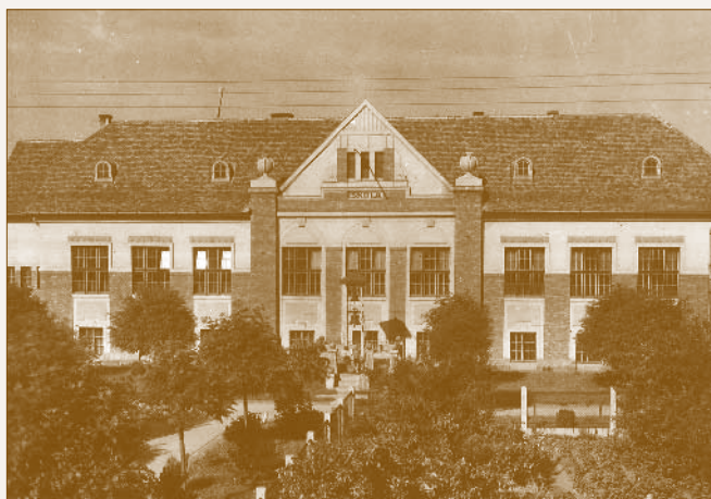
A MÁV műhelytelepi elemi (ma Bárdos Lajos) iskola

A hitélet gyakorlósa érdekében a műhelytelepi katolikus egyházközség az 1928-ban felépült elemi iskola alagsorában egy szükségkápolnát alakított ki. 38 A protestáns híveknek a