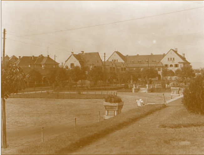
Parkrészlet a MÁV lakótelepen

telkeken épültek fel. Vidéken, pl. Miskolcon, Debrecenben önálló telkekre helyezték a lakóházakat. A többnyire négyalakos, tehát négyosztatú lakóházak 340 négyszögöles telekrészen, vagy egyedi telken álltak, és a lakásokhoz kis kertek is tartoztak. Az 1920-as évek vidéki, vasút melletti kolóniáin egyre gyakoribb lett az egyedi telkes területhasználat, ennek ellenére a Dunakeszi Főműhelyi lakótelep kétszintes épületei tömbtelkeken épültek fel. 11