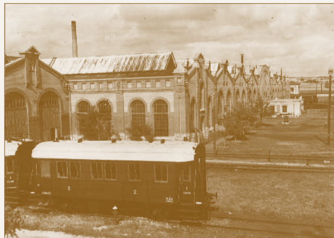
A nagycsarnok kívül...

menti futóhomok sivatagba érkeztek, amit nekik kellett zölddé varázsolniuk. 42