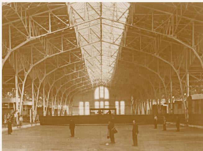
Csarnokbelső (a tolópadjárás)

A világháború kitörésével az építkezés lelassult, de nem állt meg teljesen. 1916-ban felépült a víztorony, tető alá került a kovácsműhely, 1918-ig elkészült a kocsiszerelő csarnok (a mai A-csarnok) vasvázának és vas tetőszerkezetének 95%-a, valamint a falak 60%-a. 14