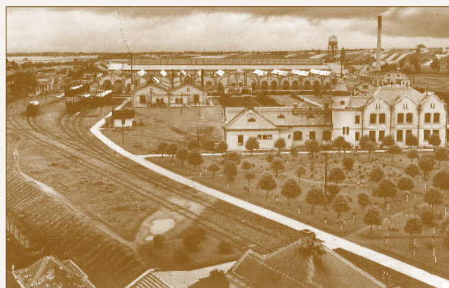
A felépült MÁV Dunakeszi Főműhely

A precízen megszervezett, gyors beköltözést követően szinte azonnal, 1926. május 31-én, hétfőn meg lehetett kezdeni az első kocsiemelést, ezért ettől a dátumtól számítjuk hivatalosan a Dunakeszi MÁV Főműhely megnyitását. 43