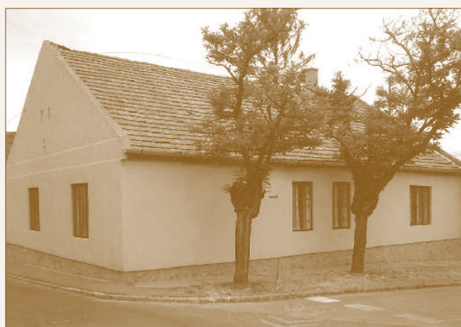
A gyűjtemény új helye, a Szent István u. 48. alatt

2012. szeptember 29-én a gyűjtemény a Szt. István u. 48. szám alatt álló „Kántorházba” költözött. Noha a hely itt sem elegendő, de mégis stílszerűen a város szívébe, a legősibb színhelyre került. Az új otthon falán a Tóth Mariska Hagyományörző Alapítvány 2014 novemberében emléktáblát is elhelyezett.