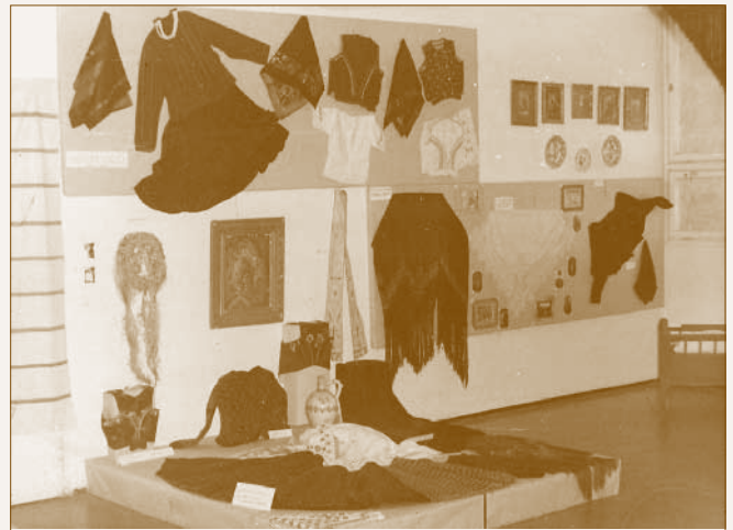
Az 1984-es kiállítás a 3. sz. (ma Bárdos Lajos) Általános Iskola aulájában