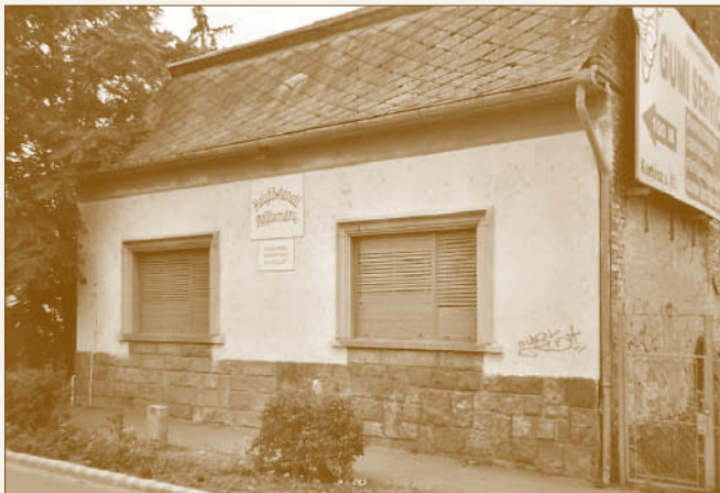
A gyűjtemény második otthona a Fő úton