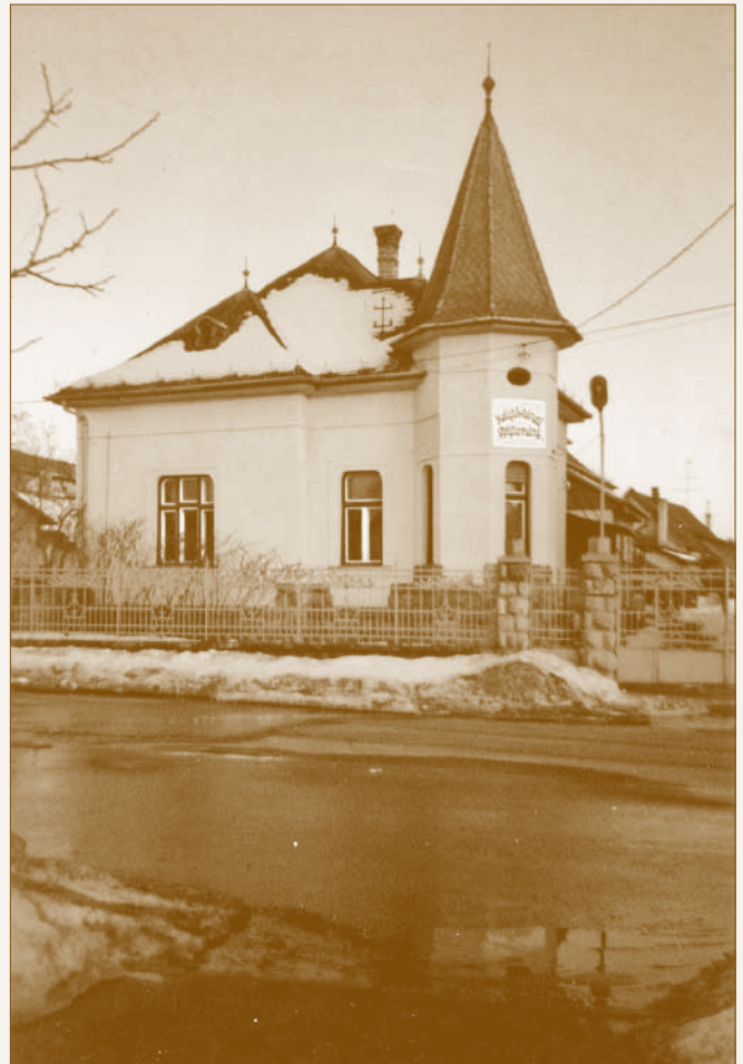
A gyűjtemény első otthona a Szent István utca 25. alatt

1994 nyarán 39 év szolgálattal nyugdíjba vonultam. A gyűjteményt az elnök jóvoltából a Városvédő Egyesület befogadta, majd helyet biztosított neki a Szent István utca 25. sz. alatti magántulajdonban levő épületben. Ez 1994. november 25-én történt, innen számítjuk a 20. évfordulót.