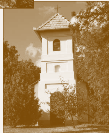
A Kegyeleti temető kápolnája felújítás előtt és után