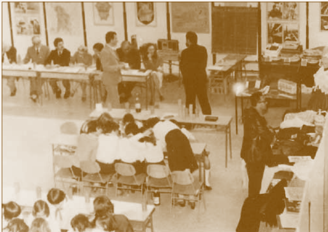
Helytörténeti vetélkedő 1980-ban