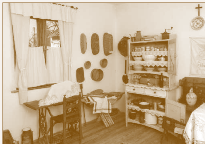
Kiállítási tárgyak, valamint a Szőke Kálmánné által berendezett konyha a Fő úti gyűjteményben

2012. szeptember 29-én a gyűjtemény a Szt. István u. 48. szám alatt álló „Kántorházba” költözött. Noha a hely itt sem elegendő, de mégis stílszerűen a város szívébe, a legősibb színhelyre került. Az új otthon falán a Tóth Mariska Hagyományörző Alapítvány 2014 novemberében emléktáblát is elhelyezett.