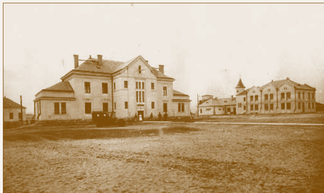
Az 1914-re felépült épületek

lefoglalta, és bennük 1915-ben sebesült katonák ápolására hadikórházat rendezett be. 13