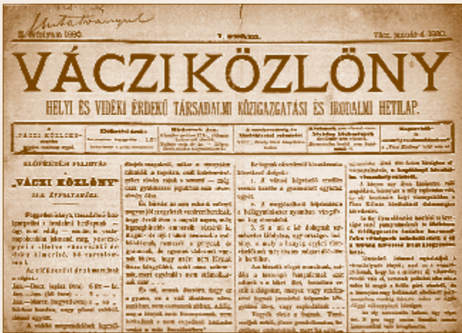
A Váci Közlöny címlapja