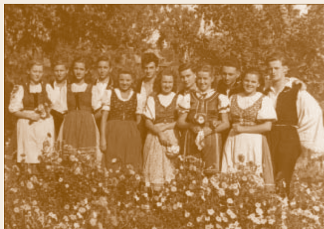
Az Árpádházi Szent Kinga cserkészcsapat táncgyűjtése

1942-ben megalakult Magyarországon a Leánycserkész Szövetség, Dunakeszi Műhelytelepen pedig megkezdte működését a 240. számú Árpádházi Szent Kinga Cserkészcsapat, akikről pár fényképen kívül nem sok adat maradt fenn. Névválasztásukat minden bizonnyal a műhelytelepi közösség 1934 óta szoros lengyelországi kapcsolatai inspirálhatták.