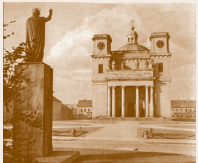
A váci Konstantin tér

A liberális újságokban merőben eltérő gondolatok olvashatóak a Néppárt gyűléséről. Szerintük szánalmas volt az egész, mert kérvényezték, hogy gyűlést tartsanak, pedig ezt elég bejelenteni. Sőt, nem is váciak voltak jelen, hanem a környező települések lakói álltak a tömegben. Szerintük a Néppárt gyűlése óriási kudarccal végződött, mire egy néppárti gúnyos a következőket üzentte: „az Isten soha a liberálisoknak ilyen kudarcot ne adjon.” 5