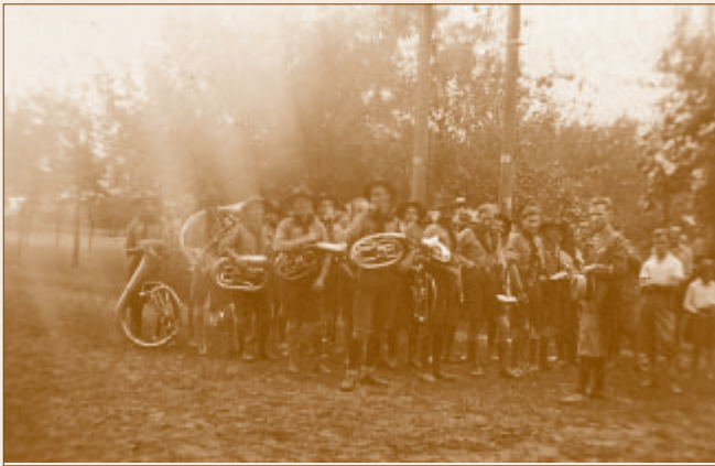
A fúvószenekar 1937 nyarán Alagon játszott