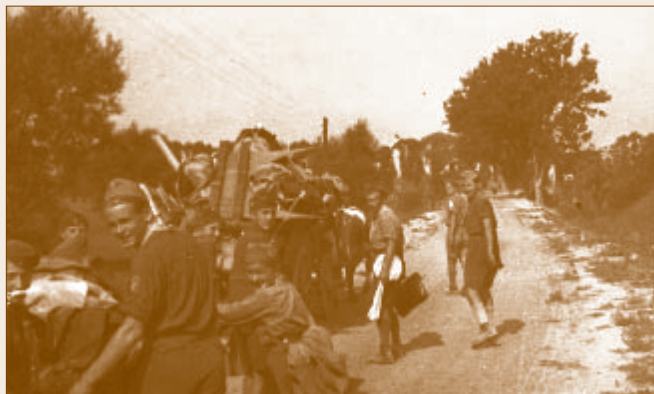
Út az állomástól a táborhelyig