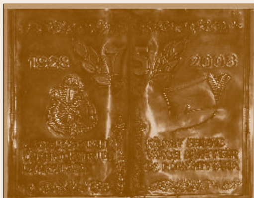
A 75 éves jubileum emléktáblája – Dér Győző alkotása

1971-től a megnövekedett könyvtári munka ellátására a főállású könyvtáros mellett egy hatórás kisegítőt is alkalmaztak. 1974-ben a Fő úti nagyközségi könyvtár is – közös fenntartású intézményként – a Vasutas Szakszervezet irányítása alá került. Majd rövidesen újra változás következett. Dunakeszi 1977-es várossá alakulása után mindkét könyvtár a Városi Tanács fennhatósága alá került. Az időközben a Kölcsey utcába költözött hajdani Fő úti bibliotéka lett a központi könyvtár, a József Attila Művelődési Házban működő intézmény pedig ennek fiókkönyvtáraként üzemelt tovább. 2000-től a Kölcsey Ferenc Városi Könyvtár 1. Sz. Fiókkönyvtára néven szerepel.