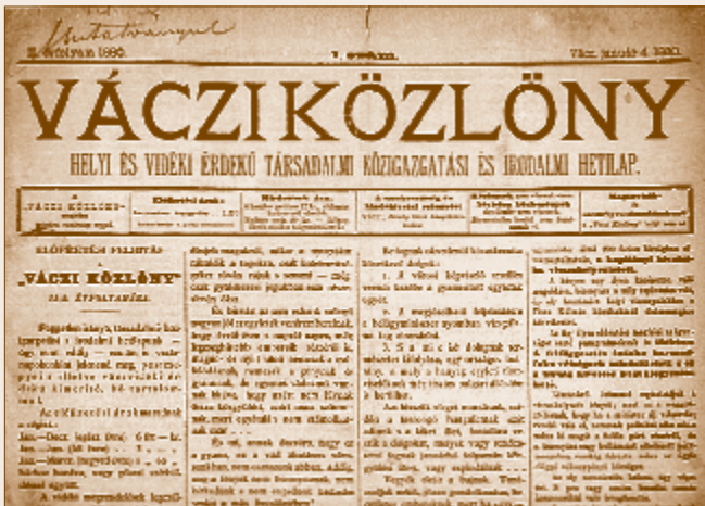
A Váci Közlöny címlapja

1896 volt az az év, amikor megromlott az egyház és a kormány viszonya, és ez volt az az esztendő, amikor Révész politikusként is feltűnt. A Váci Közlöny Helyi és Vidéki Érdekű Hetilap ekkor alakul át Politikai és Társadalmi Hetilappá , melynek a plébános több éven keresztül munkatársa volt. 1