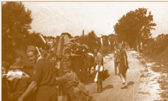
Út az állomástól a táborhelyig