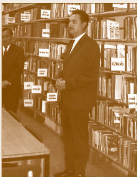
Könyvtárárat az 1969-es felújítás után

1969-ben a könyvtári helyiséget átépítették, bővítették, tágas, alumínium könyvtartókat, modern fénycsővilágítást, melegvíz-fűtést kapott. A munkálatokhoz a fenntartó, a Vasutas Szakszervezet elnöksége 150 ezer forintos támogatással járult hozzá.