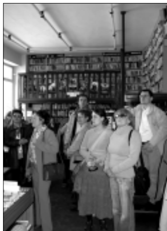
Az érsekújvári könyvtárban

Örömmel tapasztaltuk, hogy minden könyvtárnak volt magyar nyelvű könyvtárlománya, általában a lakosságban elfoglalt arányok szerinti mértékben. Könyvtárunknak már eddig is volt kapcsolata az ipolyvári könyvtárral, ahová rendszeresen szállítottunk ki olyan jó állapotban lévő könyveket, amelyek mi már nem tudtunk