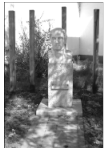
Kölcsey-szobor Demeter István alkotása

A helyismereti munka – feltárás, ismertetés, gyűjtőmunka – jelentős és fontos tevékenység a könyvtár életében. A könyvtár által kiadott ajánló bibliográfia összegyűjti a számos helytörténeti munkát, és segíti a köztük való eligazodást. A könyvhétre a második hasonló kiadvány is megjelenik.