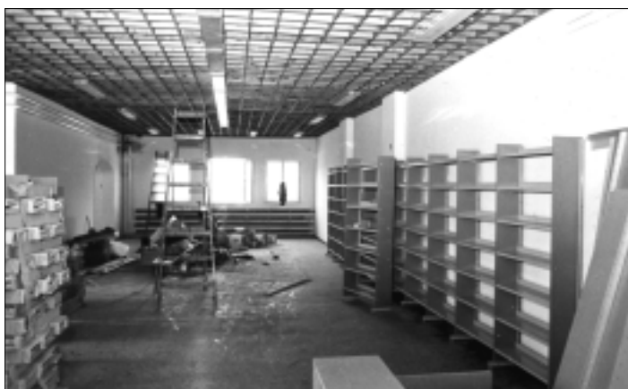
Épül a könyvtár (1986.)