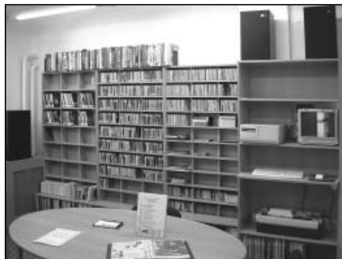
A felújított zenei és számítástechnikai részlegben az új bútorok biztosítják a kényelmes válogatási lehetőséget a folyamatosan bővülő állományból.