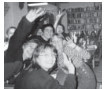
Tini Klub a Kölcsey Ferenc Városi Könyvtár 1. Sz. Fiókkönyvtárban