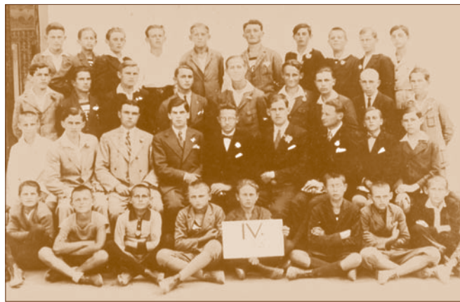
Az 1931-ben végzett negyedik osztály a László-házban