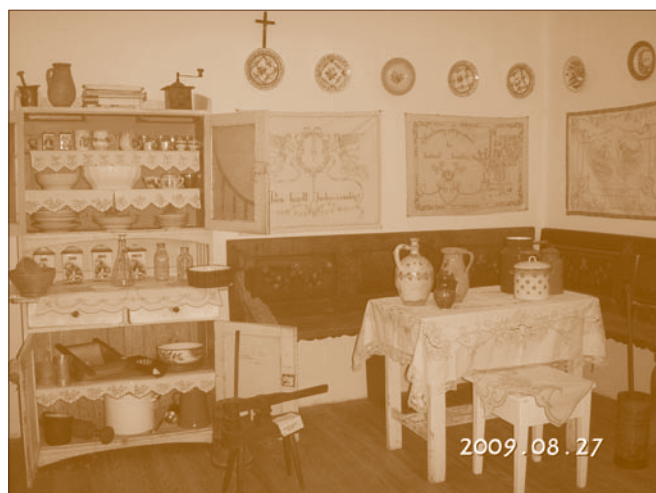
A paraszti konyha egy részlete