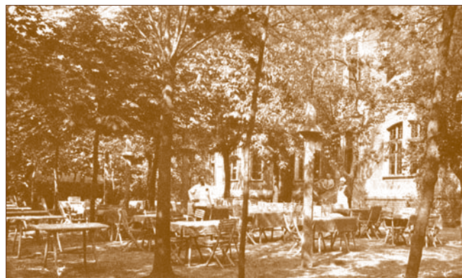
A Pavilon vendéglő kerthelyisége 1927-ben