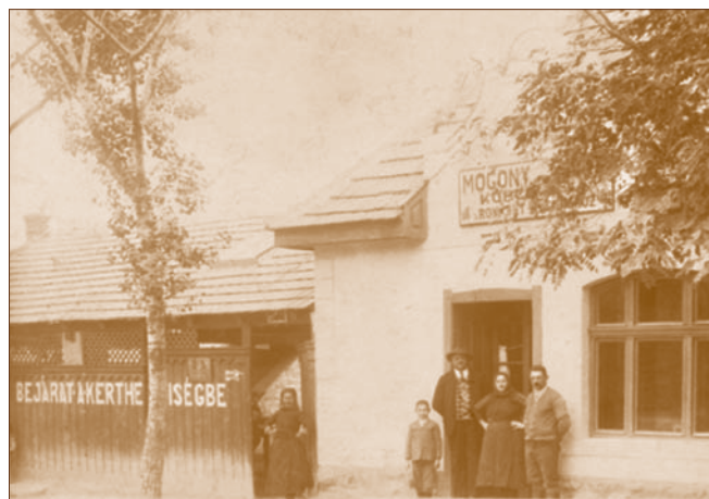
A Fő úti Mogony vendéglő