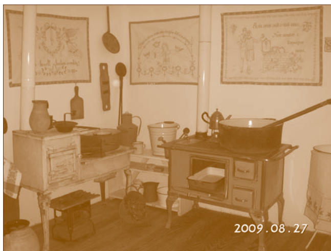
A sparhelt és a csikós sparhelt a gyűjtemény kiállításán