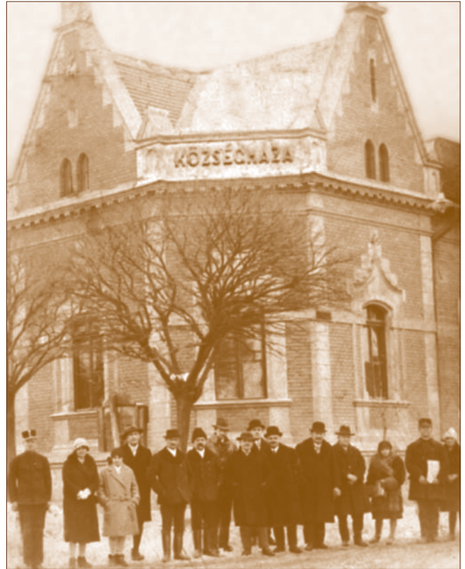
Az új községháza a felépítése utáni években

A képviselő testület egyhangúlag elhatározta, hogy tavaszkor egészen új s a czélnak megfelelő községházat építtet, mert ezen rozoga épületre melyben most vannak a hivatalos helyiségek ezen 2-3 hónapra kár volna oly sokat költeni, a helyet valamint a terveket még a tél folyamán beszerzi a képviselő testület, hogy ezen rendeletnek kora tavasszal eleget tehessen annál inkább, mert annak égető szükségét most már kénytelen volt belátni, miért az elrendelt átalakításoktól és újításoktól kérjük a most erre a néhány hónapra a községet felmenteni; mert ezen terhes költségek az új építkezéssel kárba vesznének.