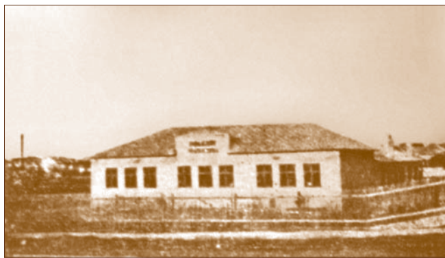
A polgári iskola épülete a Lajos utcában