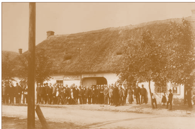
Az Uradalmi kocsmá, lebontása előtt, 1926-ban

Dunakeszi legrégebbi kocsmája minden bizonnyal a Fő út mentén, a Községháza közelében álló Uradalmi kocsmá volt. Épületét valamikor a XVIII. században emelték és nem csak kocsmaként, hanem úti fogadóként is működött, ahol az utazók szállást kaphattak és lovat is válthattak. A szájhagyomány szerint még maga Mária Terézia királynő is megfordult benne, amikor gróf Grassalkovich Antalhoz ment látogatóba Gödöllőre. A legújabb kutatások azonban ezt a vélekedést nem erősítik meg. Az Uradalmi kocsmá épületét 1926-ban lebontották, és helyére felépítették a Községi Kultúrházat, melyet Népháznak is neveztek. A még ma is álló kétszintes épület valósággal kiemelkedett a földszintes parasztházak közül, és a település büszkesége lett. Alsó szintje különböző üzlethelyiségeknek biztosított helyet. Ilyen volt például a helyiek által közkedvelt cukrászda és az Iparos Kör vendéglője is, melyet akkoriban Nagykocsmá néven ismertek. A Kultúrház adott otthont az igen népszerű színelőadásoknak, valamint a hétfőként tartott tánciskolai tanfolyamoknak. Emeleti színháztermében rendezték a bálkat és a különböző táncmulatságokat. Ilyen volt a nyári paradicsombál és az ősszel, búcsúkor tartott bál is. Dédnagymamám elmondása szerint mindig volt valamilyen rendezvény. Pestről híres színészek jöttek szerepelni, így a fiatalok számára egy helyen adatott meg a szórakozási és ismerkedési lehetőség a Kultúrház falain belül.