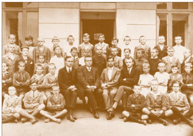
Az induló első osztály 1927-ben