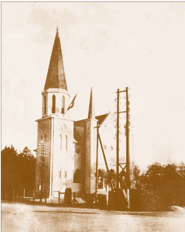
A templom épülete a 40-es években